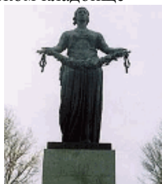
Г) Мемориал Родина-мать на Пискаревском кладбище