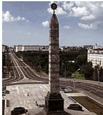
В) Красная Площадь