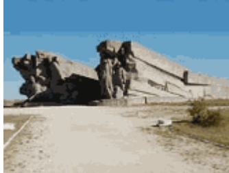
А) Мемориальный комплекс героям обороны Аджимушкая